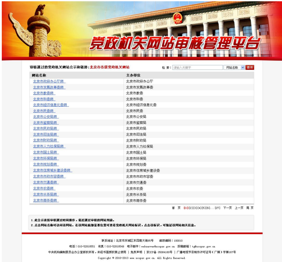
图 28（此图仅为示例，不是实际审核结果）